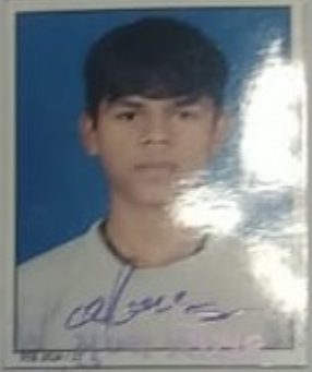
રોહિલા બા. સ. શાળા, તા. પારડી, જિ. વલસાડ.

શાળા ડાયસ કોડ :- 250204102 શાળા સ્થાપના તા. 01/08/1988 જા.નં. 64 તા. 27.1.2014