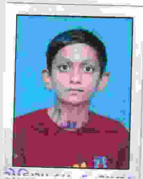
રોહિલા બા. ફ. શાળા, તા. પારડી, જિ. વલસાડ.

જિલ્લા પંચાયત શિક્ષણ સમિતિ સંચાલિત રોહિલા બ્રાહ્મણ ફળિયા શાળા, તા. પારડી, જિ. વલસાડ. શાળા ડાયસ કોડ :- 250204102 શાળા સ્થાપના તા. 01/08/1938 જા.નં. ૬૦ તા. ૨૧. ૨. 2024