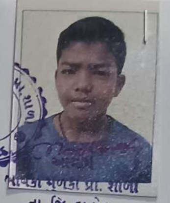
ભાવનગર યુનિવર્સિટી પ્રા. શાળા તા. જિ. દાહોદ