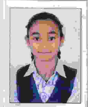
રોહિણી બા. ક. શાળા તા. પારડી, જિ. વલસાડ.