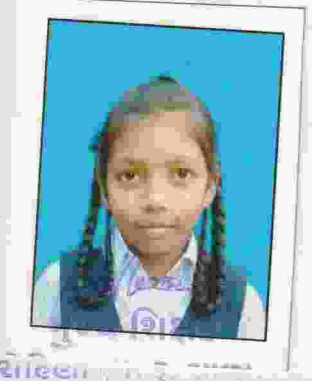
રોહિલા તા. પારડી, જિ. વલસાડ.