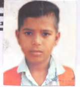
જુની એવર્ડ પ્રા. શાળા