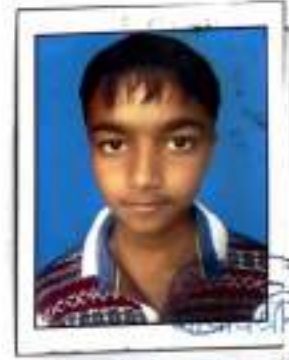
વડનગર તાલુકા પ્રા. શાળા નં-૧ તા. વડનગર, જિ. મહેસાણા